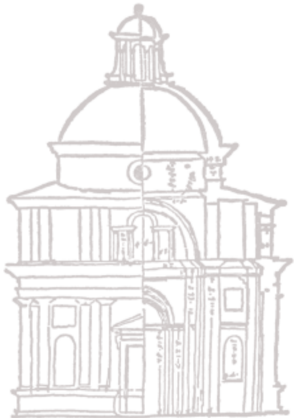
Sallustio Peruzzi - Museo degli Uffizi - Firenze, Gabinetto dei disegni e stampa n. 635A r+v

Tante volte, camminando in diversi paesi, diversi luoghi, mi è sembrato di sentire le voci dei personaggi che li hanno abitati... voci di persone... voci di artisti. Dal macro al micro... passando per l'oro... quale artista ha osservato il grandissimo e il piccolissimo più di Cellini? E quale attrazione può esercitare su di me, il tentativo di essere voce del fantasma? Enorme! Le voci, a volte, arrivano dalle stelle, che brillano!