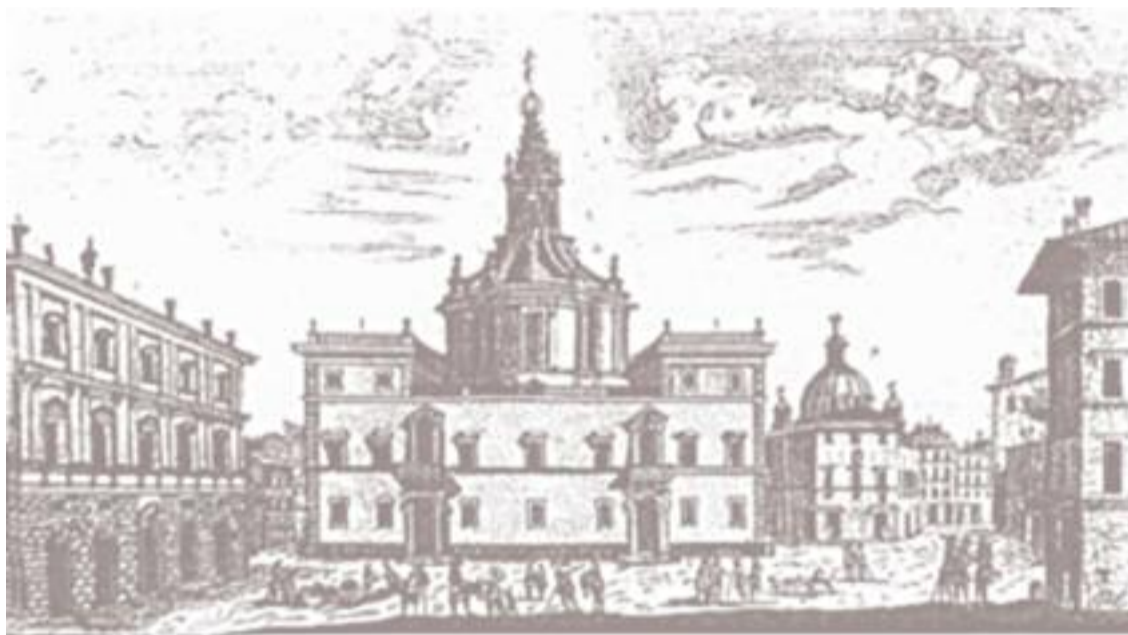
Il Palazzo della Sapienza, incisione di Giuseppe Vasi